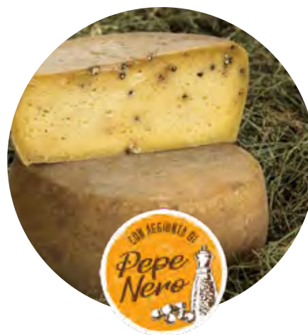
TOMA al Pepe Nero Toma con aggiunta di pepe nero.