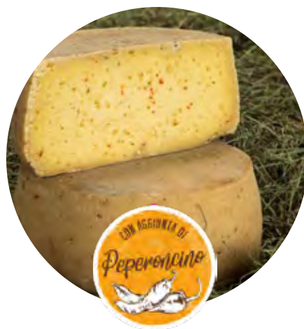
TOMA al Peperoncino Toma con aggiunta di spezie naturali.