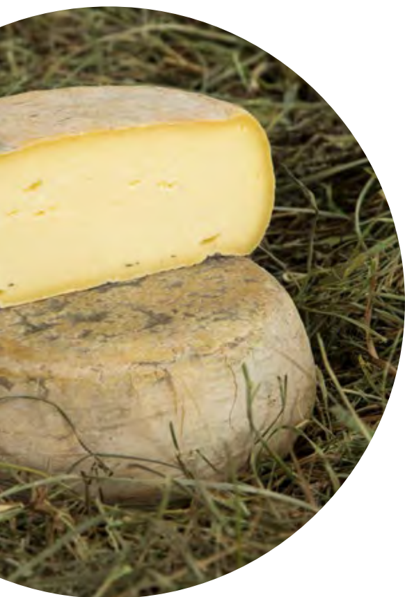
TOMA BIANCA Stagionata.

Sono formaggi a latte crudo che superano i sessanta giorni di stagionatura. Hanno il caratteristico sapore del buon latte di montagna che varia in funzione anche della stagione. Vengono prodotte diverse varietà con l'aggiunta di erbe aromatizzate e bacche che ne esaltano il gusto e le proprietà organolettiche. Più i formaggi sono stagionati più il loro sapore diventa intenso con un sentore complesso di aromi.